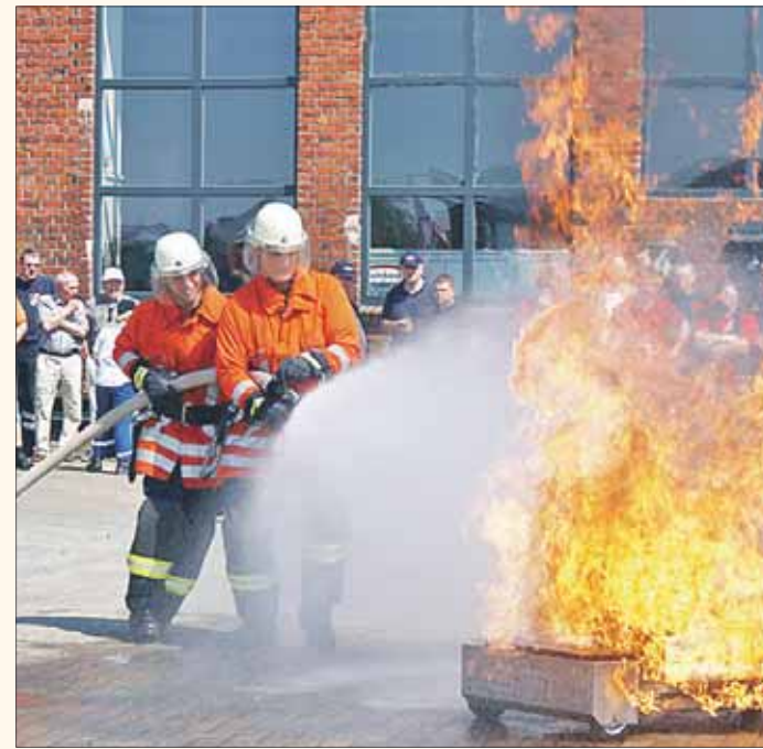
Am Wochenende wird es viel Action geben.