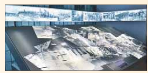
In der Baracke Wilhelmine kann man viele interessante Dinge erfahren.

Zeitgleich mit der Gewerbeschau öffnet auch die Baracke Wilhelmine auf dem Gelände ihre Türen. Dort erfahren Interessierte etwas über die Nutzung des Geländes durch das Marinegemeinschaftslager 2 Neuenkirchen, das Marinehospital