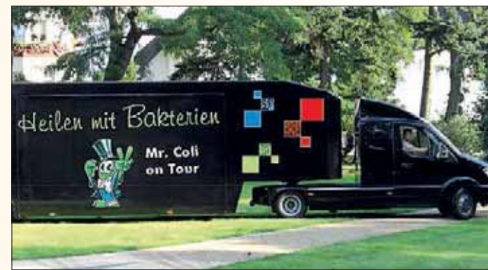
Die Schwan-Apotheke informiert auf der Gewerbeschau zum Thema Darmgesundheit und die Möglichkeit zur Sanierung. Das Team erwartet die Besucher im schwarzen „Darmmobil“.