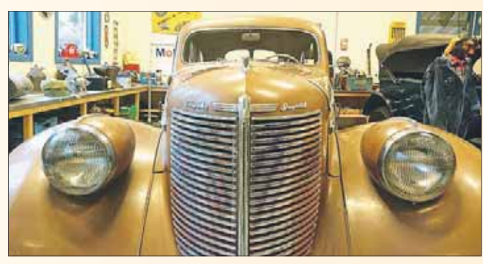
Solche Schönheiten gibt es zu entdecken.