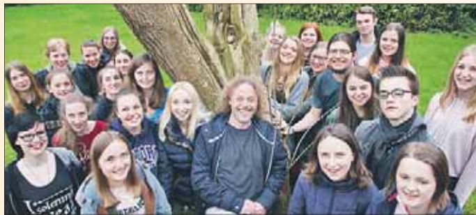
und Jugendchöre von musica sacra.