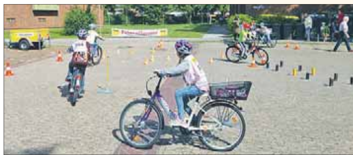
Der Fahrradparcours wurde schon an anderen Stellen gut angenommen.