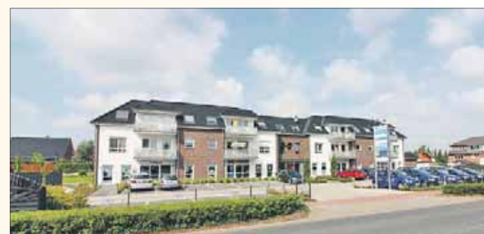
Der erste Bauabschnitt „Service-Wohnen in Schwanewede“, Heidkamp 31, wurde bereits 2016 bezogen. Der zweite Bauabschnitt entsteht jetzt am Niedersachsenring

ehemaligen Polizei entsteht ein Gebäude mit 20 seniorengerechten Wohnungen. Barrierefreies Wohnen ist auch der Schwerpunkt des neuen geplanten Wohnquartiers „Barrierefreies Wohnen in Beckedorf“ an der Bahnhofstraße. Hier entstehen in bester Lage ebenerdige Einzel- und Doppelhäuser auf kleinen, kompakten Grundstücken. Baubeginn ist für 2019 geplant. In der Schwaneweder Straße 283, direkt an der Landesgrenze, entstehen vier modern ausgestattete Eigentumswohnungen. Das Modell „Classico IV“ eignet sich besonders für Kunden, die sich gegen ein Einfamilienhaus entscheiden oder deren Immobilie nicht mehr den aktuellen familiären Ansprüchen genügt. FR