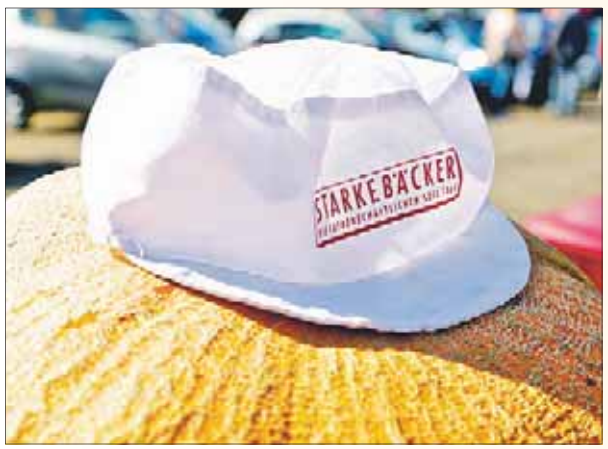
Das Cappy ist tief ins Gesicht gezogen – so wartet der Kürbis auf seine Herausforderer.

Kürbisstemmen – das etwas andere Fitnessprogramm auf der Gewerbeschau