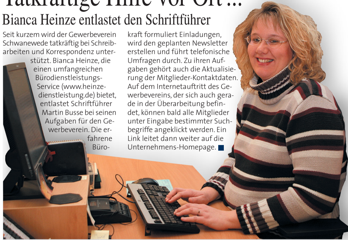
© Texte und Bilder: Doris Friedrichs | © Gestaltung/Grafik: Anzeigenagentur Pillnick

kraft formuliert Einladungen, wird den geplanten Newsletter erstellen und führt telefonische Umfragen durch. Zu ihren Aufgaben gehört auch die Aktualisierung der Mitglieder-Kontaktdaten. Auf dem Internetauftritt des Gewerbevereins, der sich auch gerade in der Überarbeitung befindet, können bald alle Mitglieder unter Eingabe bestimmter Suchbegriffe angeklickt werden. Ein Link leitet dann weiter auf die Unternehmens-Homepage. ■