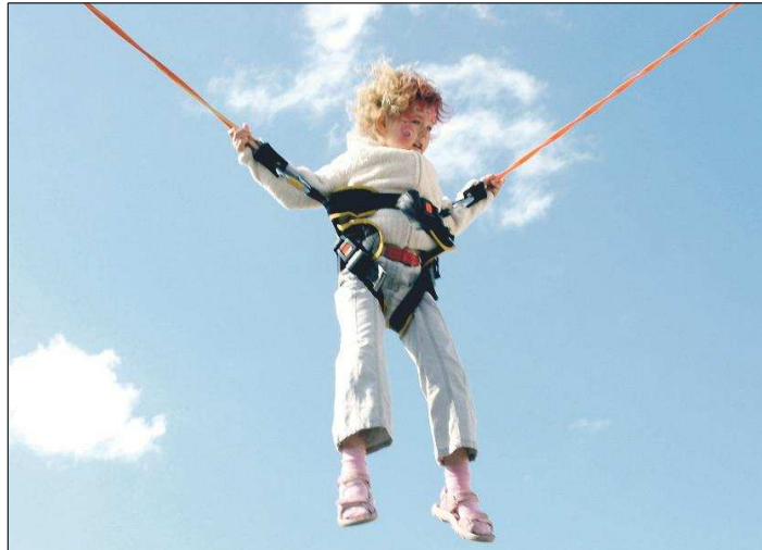
Bungee Jumping war vor zwei Jahren der „Hit für Kids“ auf der Gewerbeschau.

Die Planungen laufen bereits auf Hochtouren. Ende August liegt das Zentrum Schwanewedes zwei Tage lang wieder im Gewerbegebiet Neuenkirchen. Am Wochenende 30. und 31. August stellen sich zwischen Steller und Rader Heide Handwerker, Händler, Dienstleister, kommunale Einrichtungen und Vereine mit ihrem Angebot und ihrem Service auf der Gewerbeschau 2008 vor. Versprochen sind eine Fülle von Informationen, Präsentationen und ein umfangreiches Rahmenprogramm in zwei großen Ausstellungszeiten sowie entlang des Messegeländes. Schwerpunkt der diesjährigen Gewerbeschau wird