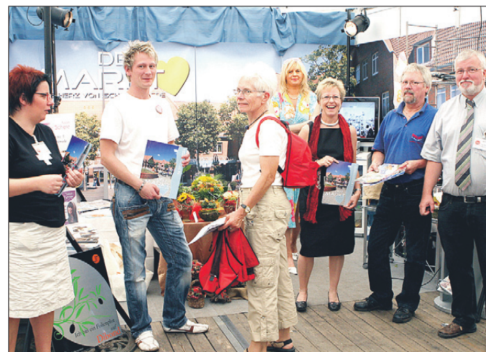
Mitglieder der IG „Der Markt – Das Herz von Schwanewede“.