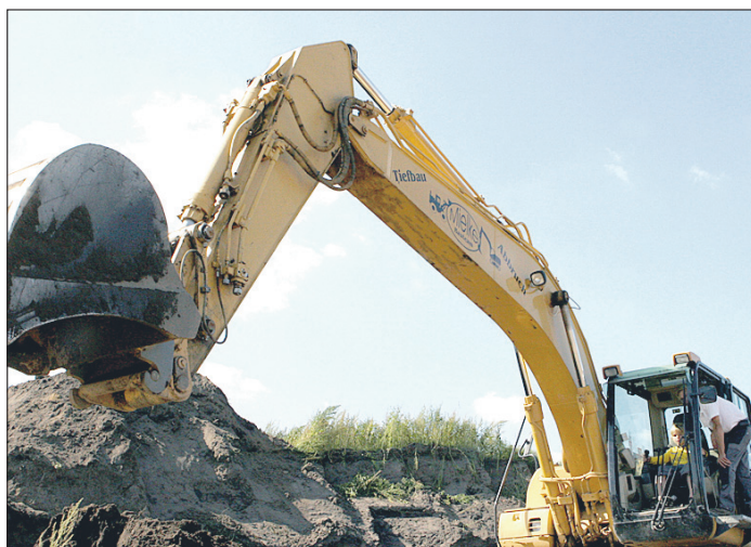
Klein übt sich, was einmal ein großer Baggerfahrer werden will.