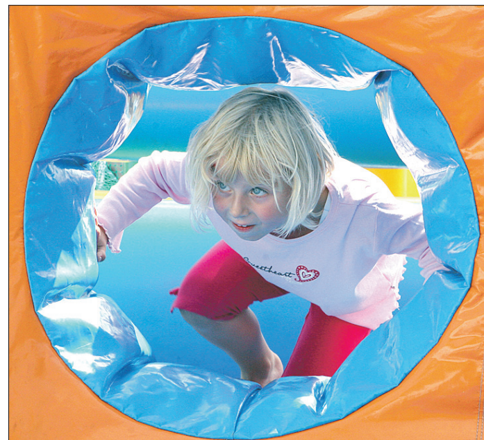
Gehörte unbestritten zu den Favoriten der jungen Gewerbeschau-Besucher: die Hüpfburg.