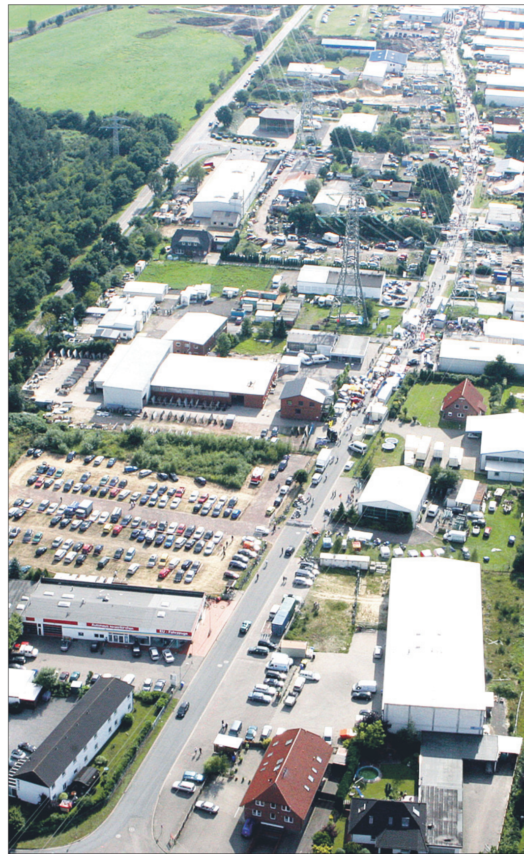
Das gut besuchte Gewerbegebiet aus der Vogelperspektive.