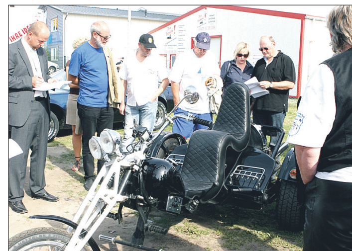
Großer Andrang herrschte bei der Versteigerung der Oldtimer und Trikes.