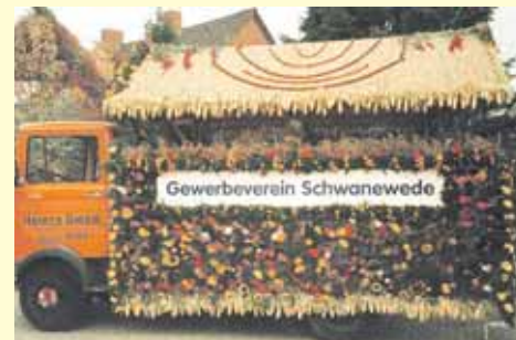
Zum Erntefest präsentierte sich vor 25 Jahren der Schwaneveder Gewerbeverein erstmals der Öffentlichkeit mit einem eigenen Wagen.