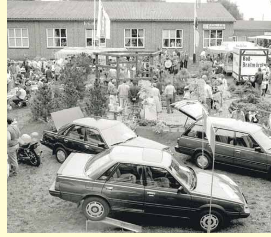
DIE ERSTE GWERBESCHAU 1985 WURDE MIT RUND 15.000 BESUCHERN EIN VOLLER ERFOLG.

Wenn Sie einen besonderen Wunsch frei hätten, welcher wäre dies dann in Bezug auf Schwanewede? Dass der Gewerbeverein noch mindestens weitere 25 Jahre besteht. Wie sehen Sie die mittel- und langfristige wirtschaftliche Zukunft Schwanewedes? Schwanewede ist eine attraktive Stadt und wird dieses auch weiterhin bleiben. Wenn sich derzeit auch die Wirtschaftskrise durch stagnierende Bautätigkeit bemerkbar macht, Der Einbruch ist längst nicht so stark, wie viele befürchtet haben. Schwanewede hat sich zu einer beliebten Wohnstadt entwickelt, sie wird es künftig bleiben. Der Hauptaugenmerk sollte dabei auf den Pendler gerichtet sein, die ein angenehmes, grünes Wohnumfeld in Stadtnähe bevorzugen. Was wünschen Sie den Gästen anlässlich der Jubiläumsfeier? Einen informativen Abend! Denn: Es sind viele hochkarätige Politiker auf einmal da – was nicht so häufig passiert. Den Gästen wünsche ich, dass sie diese Chance nutzen und viele Fragen stellen.